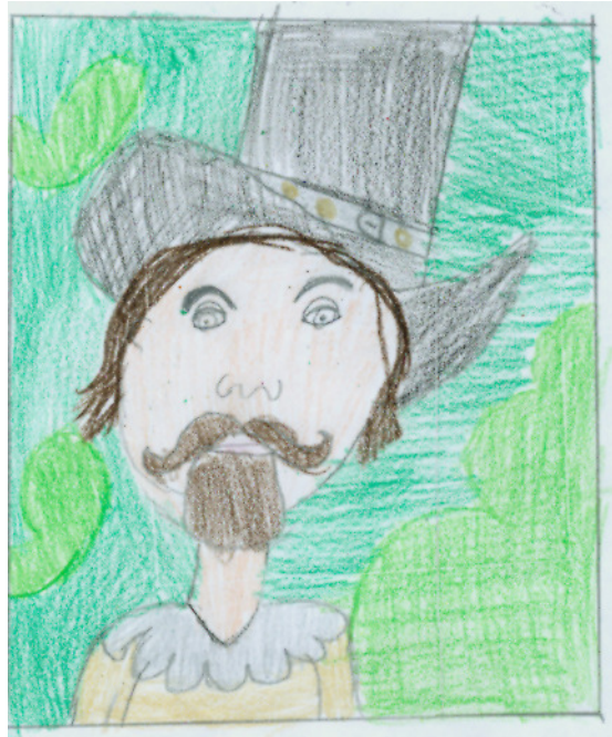
Paul Peter Rubens, gemalt von Eva