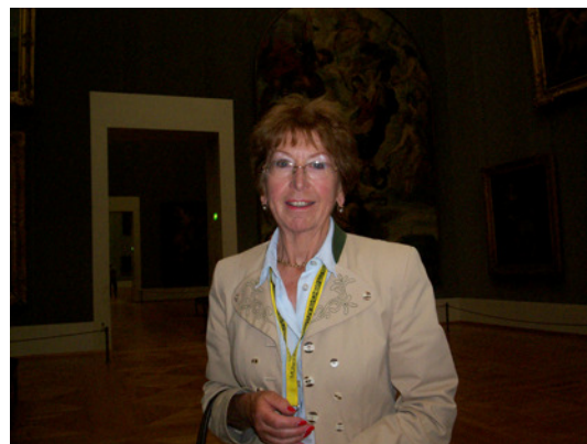
Diese Dame weiß aber ganz schön viel!

Antwort: Das letzte Gericht im Himmel. Oben ist Christus und er hat zu seiner Rechten die Guten und zu der Linken die Bösen und die poltern in der Höhle.