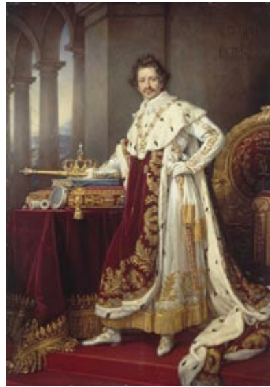
König Ludwig I. im Königsgewand

Ludwig der I. hat die Alte Pinakothek bauen lassen, der Architekt heißt Leo von Klenze. Leo von Klenze war ein sehr guter Freund von Ludwig der I..