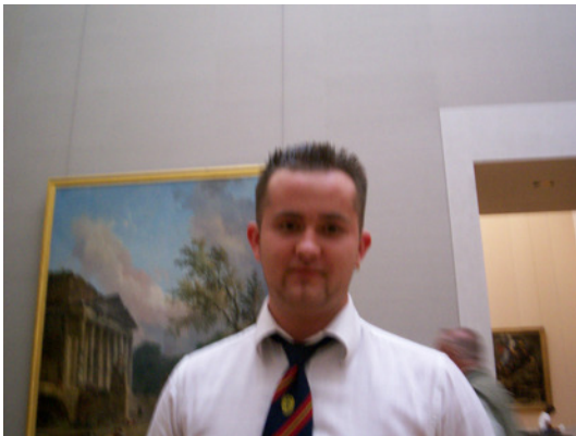
Dieser Herr arbeitet hier im Museum.

Antwort: Ein wunderschönes Museum mit den wunderschönsten Bildern aus ganz München. Dankeschön und auf Wiedersehen.